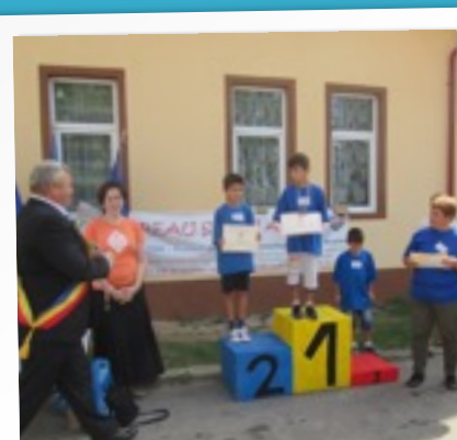
PRIMARUL ACORDA MEDALII PREMIATILOR