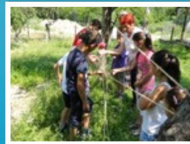
JOCUL AFARĂ ÎN CURTE