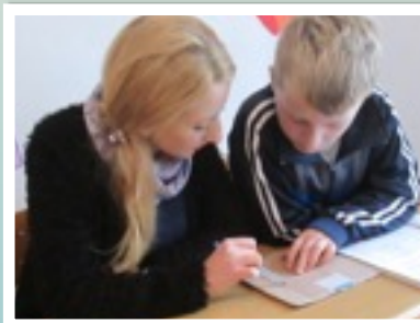
SPRIJIN LA TEME