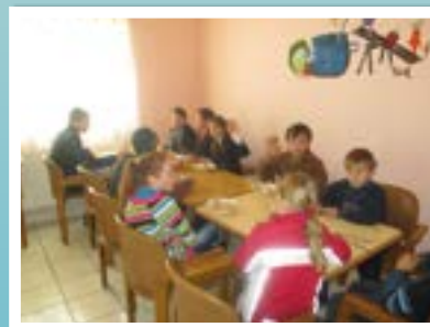
MĂSĂ CALDĂ SĂNĂTOASĂ